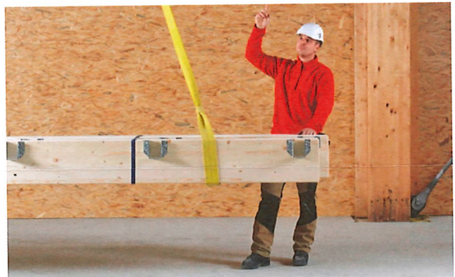
1 Die Ausbildung der Anschläger und Anschlägerinnen soll im gewohnten Arbeitsumfeld stattfinden.

Beim Anschlagen von Lasten ereignen sich immer wieder schwere Unfälle. Deshalb dürfen nur ausgebildete Personen Lasten an Kranen anschlagen. Verantwortlich für die Auswahl und Ausbildung der Personen sind die Arbeitgeber.